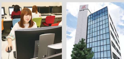
日本商务公务员专门学校