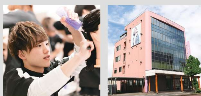
CREA Hair mode专门学校