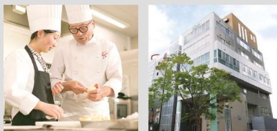
厨师糕点师专门学校