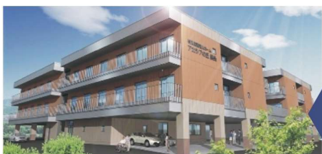
特别保健老人之家“AKASIKA之丘黑条” 短期工作设施“服务中心黑条” “客居黑条”