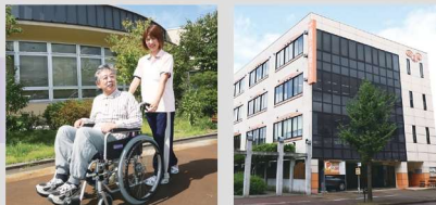
长冈儿童福祉专门学校 护理福祉科