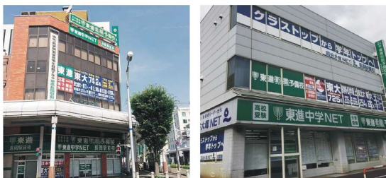
东进卫星预备校 长网站前校·长网站东校